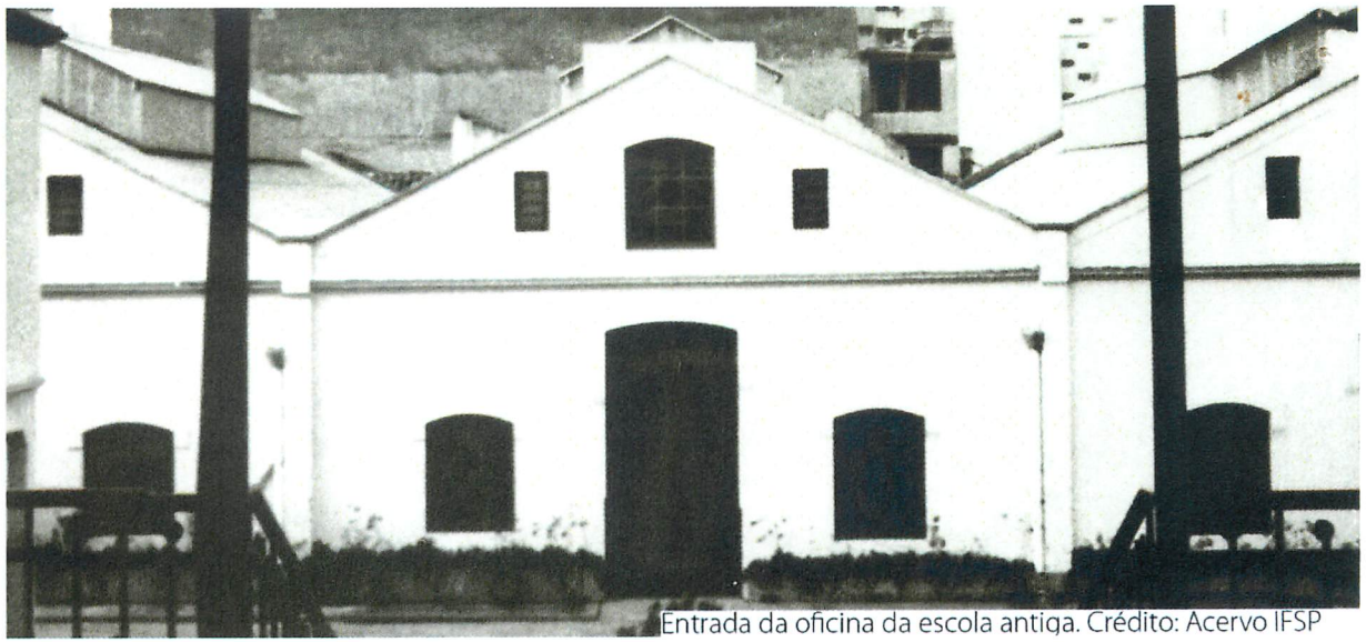
Entrada da oficina da escola antiga.