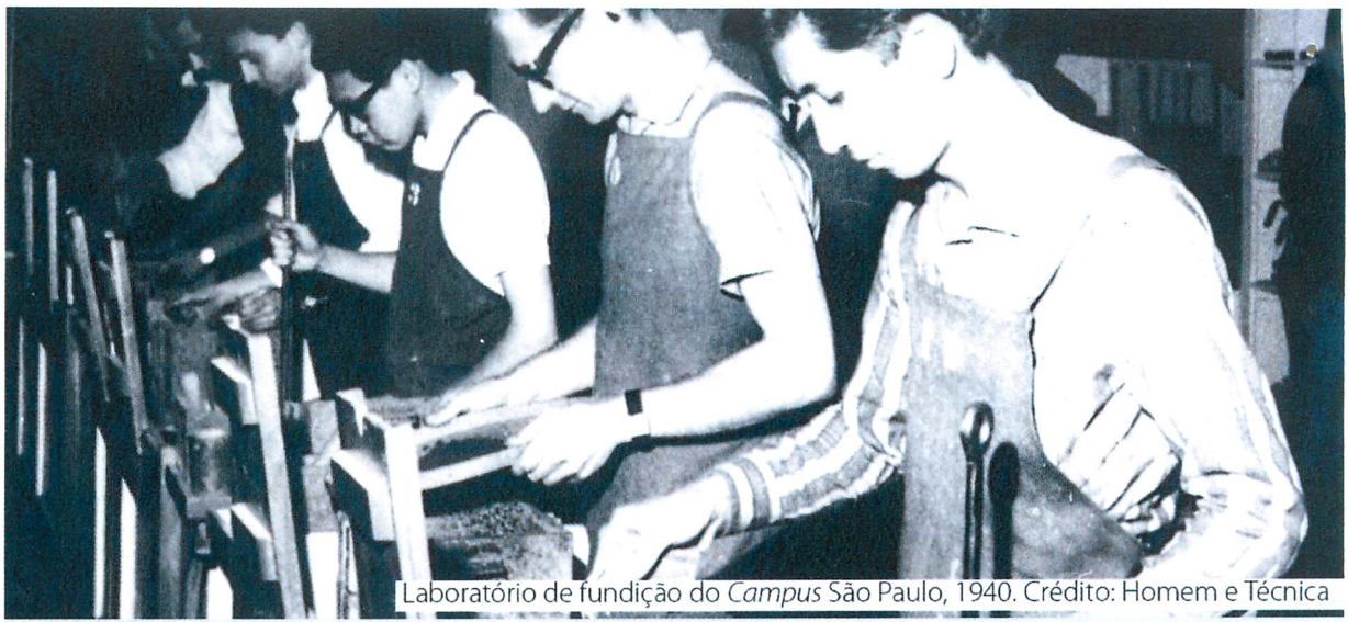
Laboratório de fundição do Campus São Paulo, 1940.