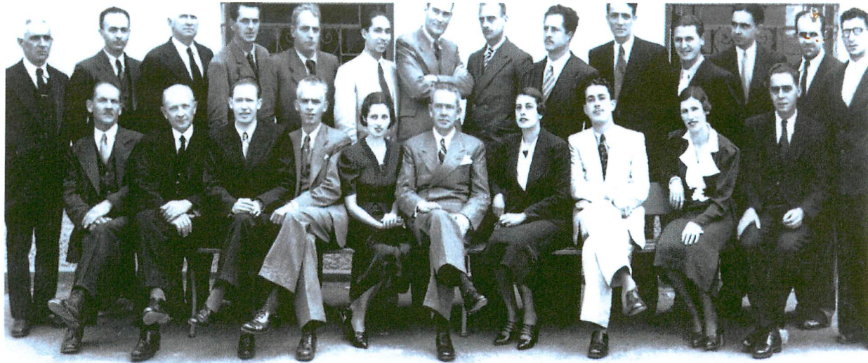
Corpo docente da Escola em 1945.