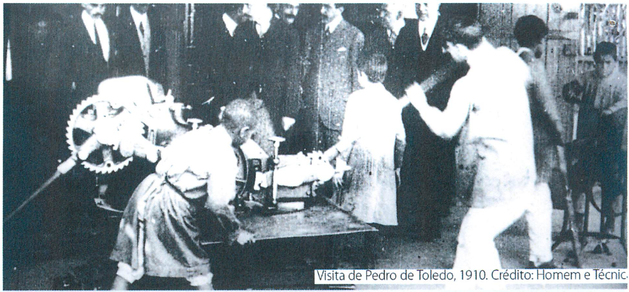
Visita de Pedro de Toledo, 1910.