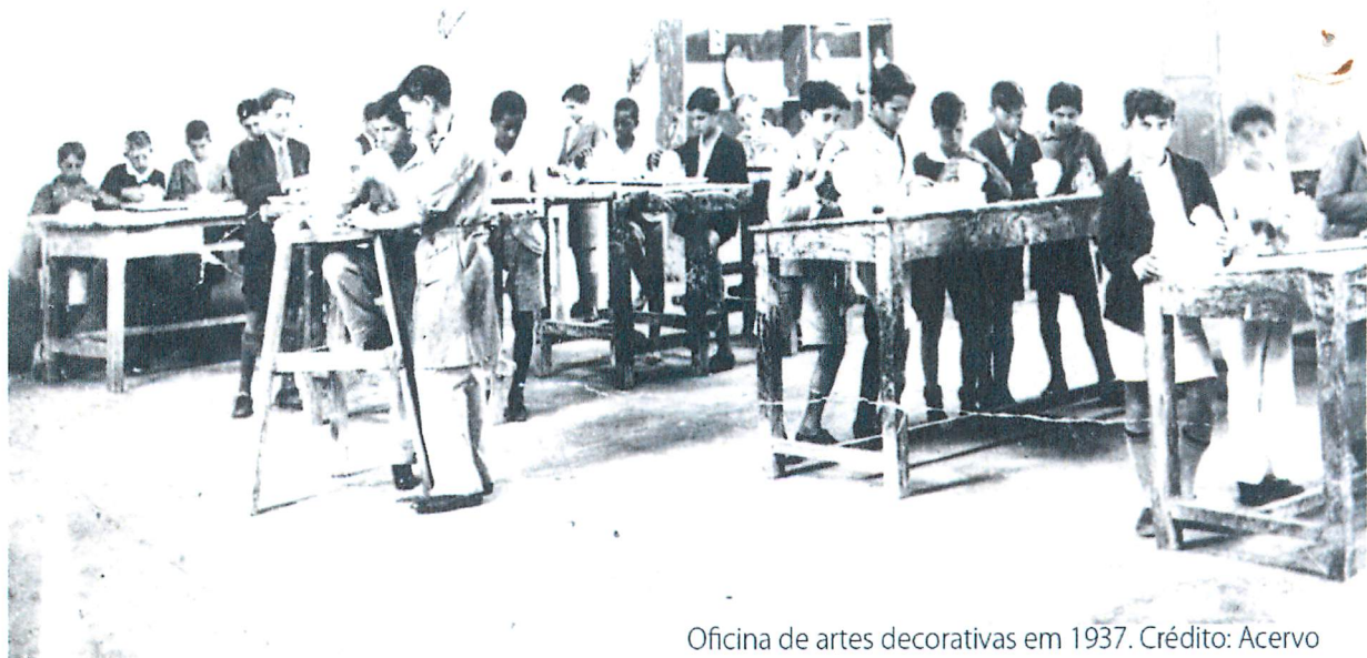
Oficina de artes decorativas em 1937.