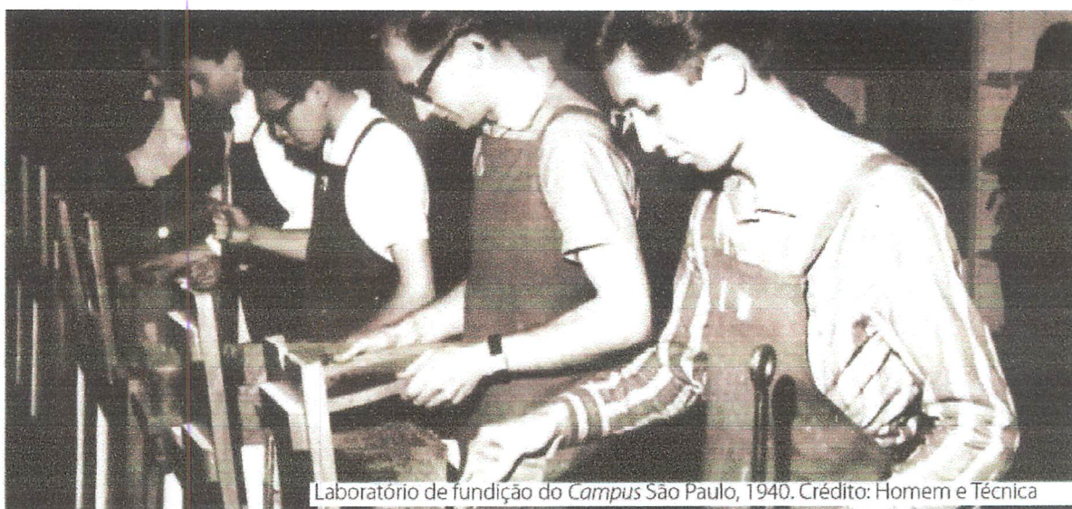
Laboratório de fundição do Campus São Paulo, 1940.

IFSP - Campus Presidente Epitácio - Curso Superior de Tecnologia em Análise e Desenvolvimento de Sistemas: Semestral - Módulos: 20 (vinte) semanas