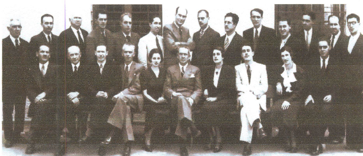
Corpo docente da Escola em 1945.

IFSP - Campus Presidente Epitácio - Curso Superior de Tecnologia em Análise e Desenvolvimento de Sistemas: Semestral - Módulos: 20 (vinte) semanas