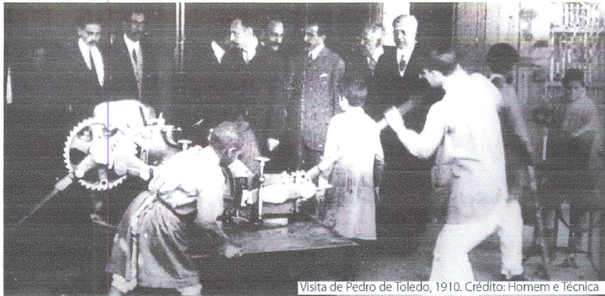
Visita de Pedro de Toledo, 1910.