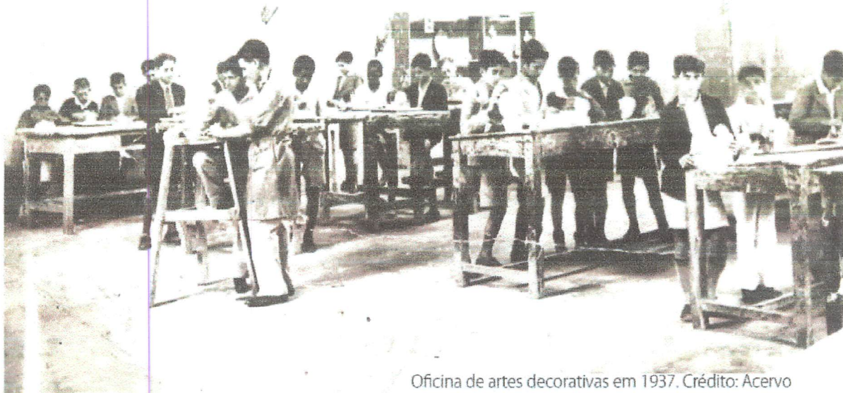
Oficina de artes decorativas em 1937.