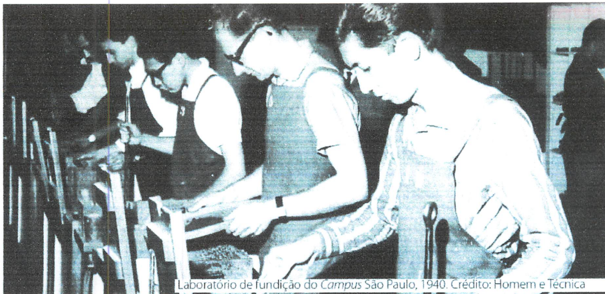
Laboratório de fundição do Campus São Paulo, 1940.

IFSP - Campus Presidente Epitácio - Cursos Técnicos Concomitante/Subsequente: Semestral Módulos: 19 (dezenove) semanas