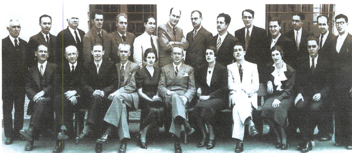
Corpo docente da Escola em 1945.

IFSP - Campus Presidente Epitácio - Cursos Técnicos Concomitante/Subsequente: Semestral Módulos: 19 (dezenove) semanas