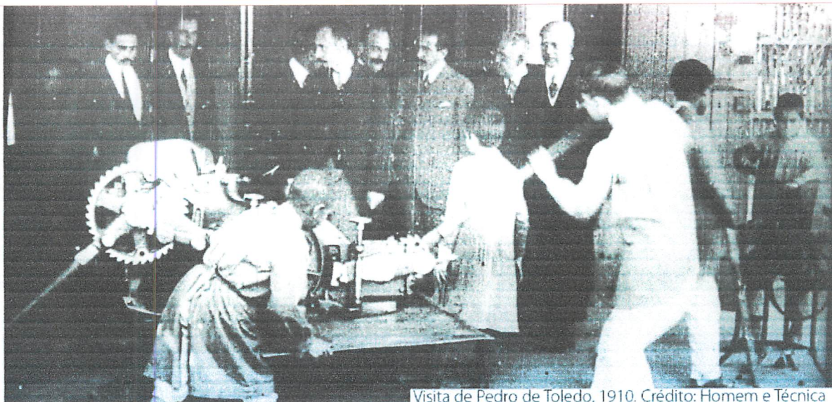
Visita de Pedro de Toledo, 1910.

IFSP - Campus Presidente Epitácio - Cursos Técnicos Concomitante/Subsequente: Semestral Módulos: 19 (dezenove) semanas