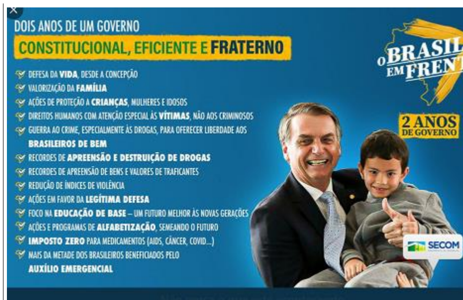
Imagem similar em escala maior.