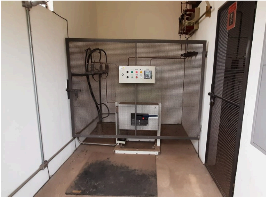
Figura 2 - Foto interna da cabine primária de energia