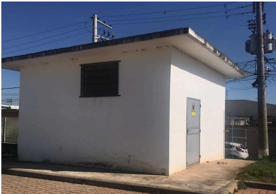
Figura 4 - Foto externa da cabine primária e local de instalação (lateral) do quadro de desarme/rearme