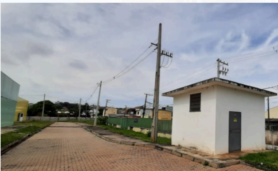
Figura 1 - Foto externa da cabine primária de energia

5.1.8. Abaixo seguem fotos ilustrativas da cabine primária.